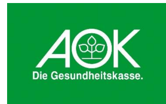
AOK Die Gesundheitskasse in Hessen